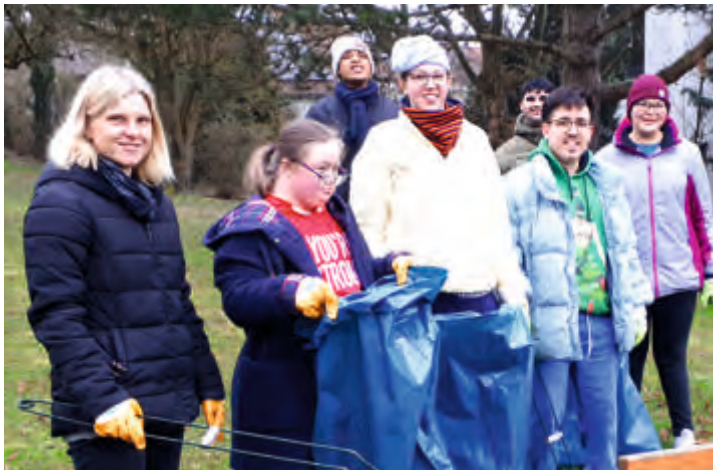
Die Gustav-Werner-Schule hat sich schon vorher an der Putzete beteiligt.