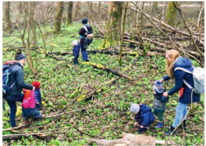
Mit der Waldspielgruppe die Natur erkunden!