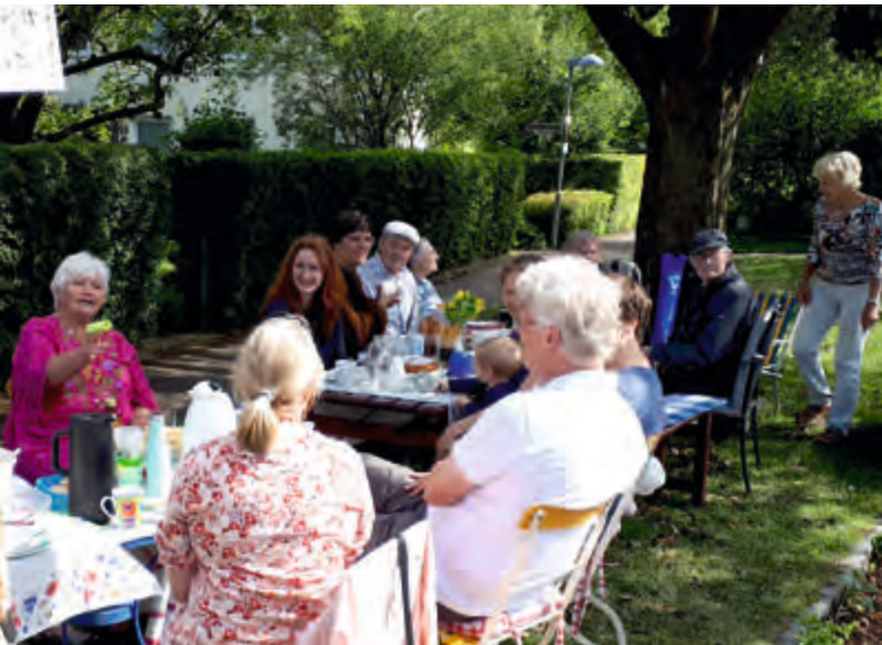
Gute Gespräche am Tag der Nachbarschaft