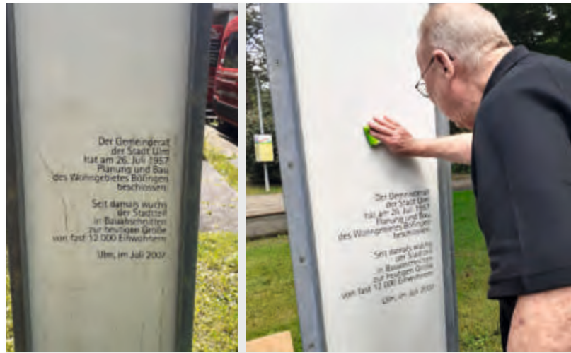
Dr Antelmann hat diea drägada Steele buzzt saubr gschaffad, dank shee (Bidle vorher nochher)

Der Parksommer ist vorbei – leider sind nicht viele Menschen gekommen. Es steckt so viel Arbeit dahinter – schade, dass es wenig gewürdigt wurde. Den kostenlosen Kuchen wollten manche schon mitnehmen, aber sich dazu setzen – nein. Schade, gut gemeint – nicht angenommen.