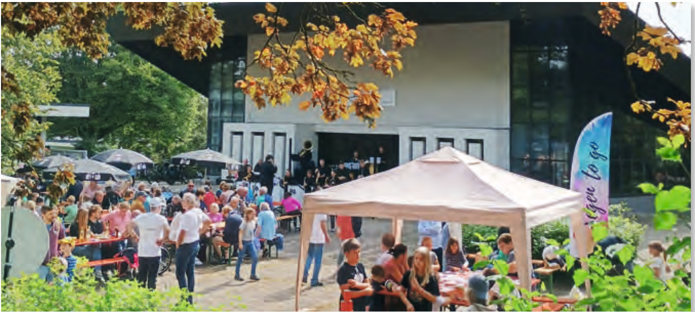
9. Böfing er BigBand-Biergarten