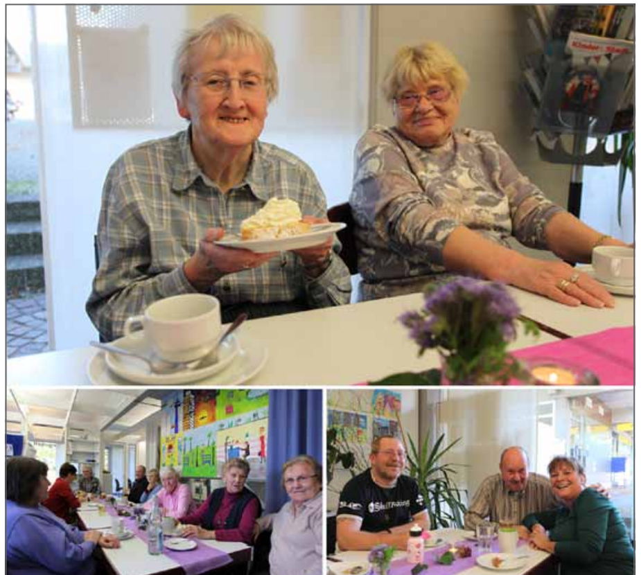
Impressionen aus dem Café Kanne: Fröhliche Gesichter bei guten Gesprächen und leckerem Kuchen.