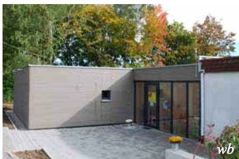
Der kath. Kindergarten St. Christophorus