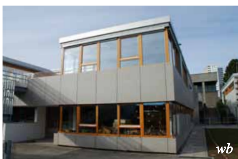
Der kath. Kindergarten Don Bosco