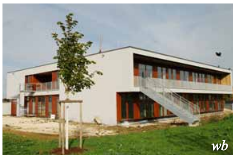
Der Kindergarten im Lettenwald