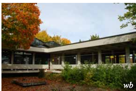
Der ev. Kindergarten Zwergenkiste