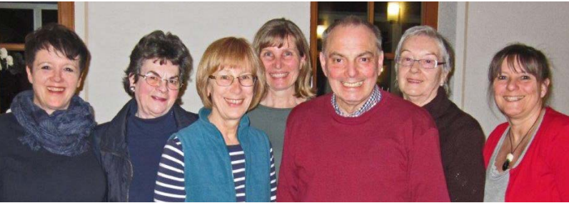
Immer montags das „Café Kanne“ mit leckeren selbstgebackenen Kuchen, hier das gutgelaunte Team des „Café Kanne“.

Im Bürgertreff ist immer was los, besonders am Nachmittag ist fast täglich reger Betrieb: