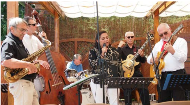
Strahlender Sonnenschein beim Jazz-Frühshoppen.

Unser Jazz-Frühshoppen im Restaurant „bei Pippo“ (Panorama in den Kleingärten im unteren Braunland) fand im Juni wieder mit der Band strassJAZZ statt. Der Wettergott hat es dieses Mal sehr gut mit uns gemeint. Es waren zwar auf Grund der vielen Veranstaltungen in der Stadt nicht so viele Besucher da wie im Vorjahr. Aber gut besucht. Auffallend war, dass dieses Mal sehr viele Böfing gekommen sind. Das freut uns natürlich sehr, weil wir ja hauptsächlich für unsere Böfing die Kulturdinge veranstalten.