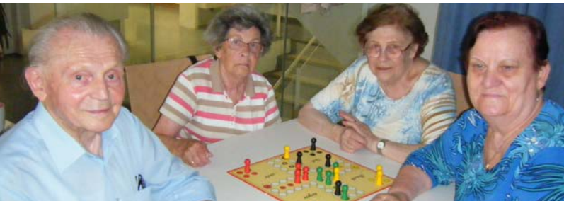
Mittwochs und freitags werden beim Kaffee- und Spieletreff die Würfel gerollt und die Karten gemischt.