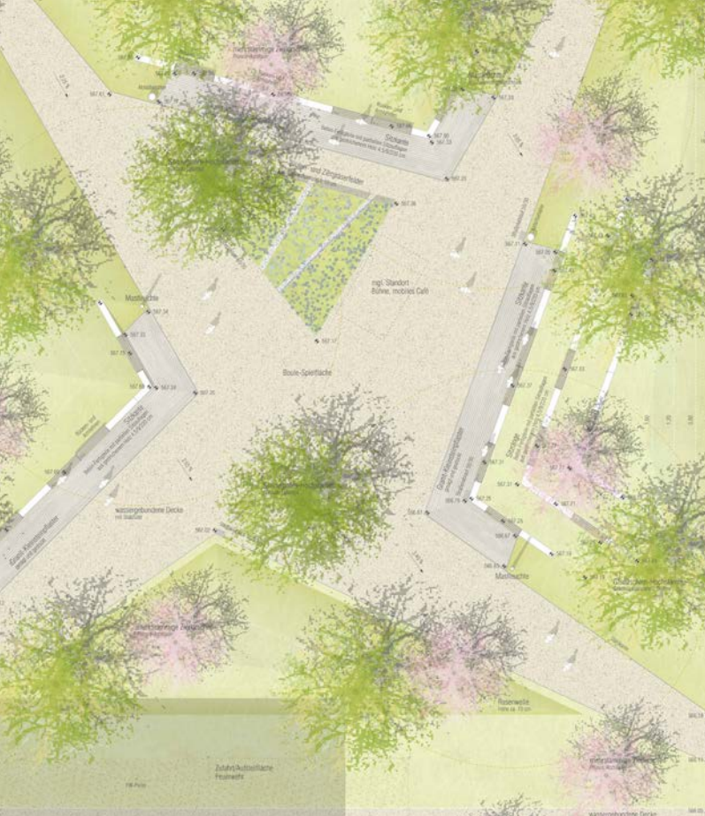
Entwurf des Quartiersplatzes Lettenwald von den Landschaftsarchitekten „silands“