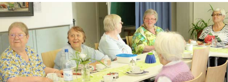
Donnerstags treffen sich im Sträkelcafé kreative Köpfe.

Es gibt also keinen Grund, sich daheim zu langweilen – kommen Sie doch einfach mal vorbei! gl