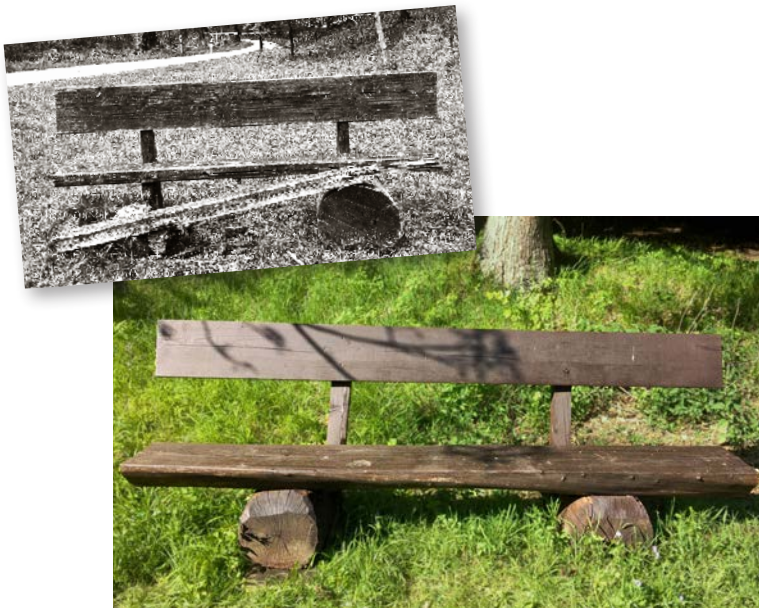
Oben die alte, morsche Bank am Rückhaltebecken im Örlinger Tal. Sie wurde mittlerweile durch eine neue Bank (unten) ersetzt.