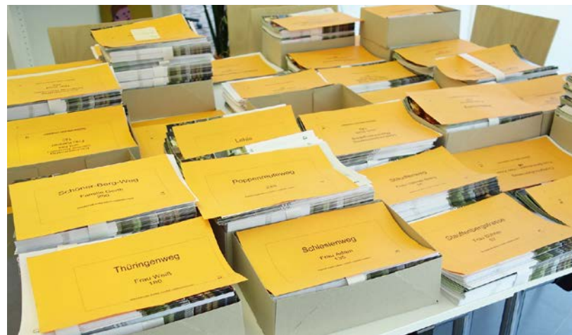
6.500 Exemplare des letzten böfinger bürger blättles wurden nach Straßen sortiert und warten im Erdgeschoss des Bürgertreffs auf ihre Verteilung.

Was wäre das böfinger bürger blättle ohne seine ehrenamtlichen Austrägerinnen und Austräger?