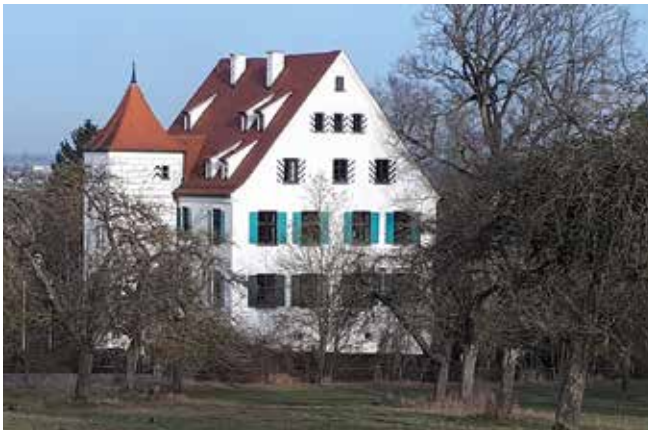
Gebäude mit langer Geschichte: Das Schloss Oberthalfingen.