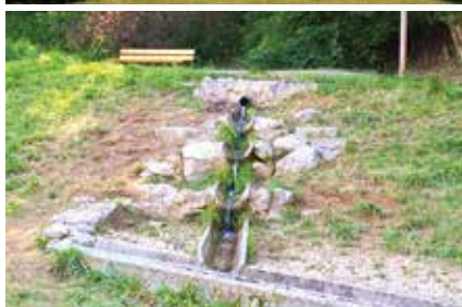
Der Buchbrunnen lädt zum Verweilen ein.

Der Buchbrunnen ist auch wegen des Halbtrockenrasens Bestandteil der Naturdenkmalliste der Stadt.