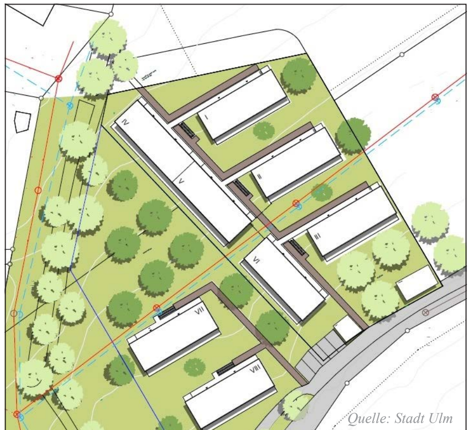
Plan der neuen Flüchtlingsunterkünfte am Böfinger Weg