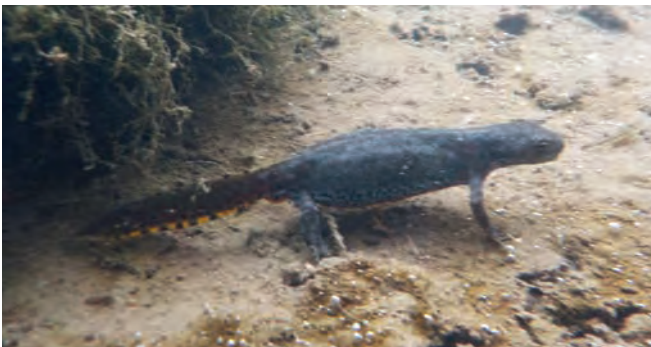
Diese Lurche haben sich im Böfing er Tümpel angesiedelt – oben ein Männchen, unten ein Weibchen.

Nachdem seit über einem Jahr das Wasser wieder in den Tümpel fließt, haben sich mehrere Bergmolche angesiedelt. Der Bergmolch, auch als Alpenmolch bekannt, ist ein Schwanzlurch und gehört zu den Amphibien. Er war 2019 „Lurch des Jahres“.