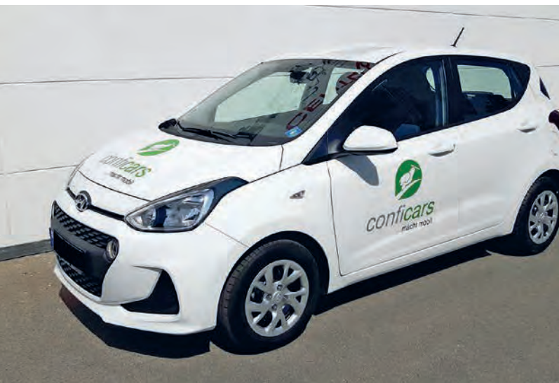
Dieser Hyundai i10 steht auf dem Parkplatz von CPI Ebner und Spiegel zum Mieten bereit.

In Ulm und Neu-Ulm sind 21 weitere Car-Sharing-Fahrzeuge in verschiedenen Fahrzeuggrößen an 17 Standorten von conficars verteilt. Alle Fahrzeuge sind rund um die Uhr über das Internet oder eine App buchbar. Alle Informationen erhalten Sie über www.conficars.de oder bei einem Anruf unter 0731/9464551. Confitech Dienstleistungs GmbH, 89081 Ulm-Jungingen, Lehrer Str. 1, info@conficars.de Holger Tinsz, Fuhrparkmanager