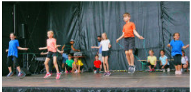
Auf der Bühne war ordentlich was los, es gab Showeinlagen verschiedener Gruppen, wie hier die Rope Skippers des VfL.

Auf der Bühne wurde ein abwechslungsreiches Programm geboten und es war schön zu sehen, wie viele Talente wir in unserem Stadtteil haben! Auch in kulinarischer Hinsicht kamen alle auf ihre Kosten. Ein Riesendank an alle fleißigen Helferinnen und Helfer, ohne die dieses Fest nicht möglich gewesen wäre. Super!