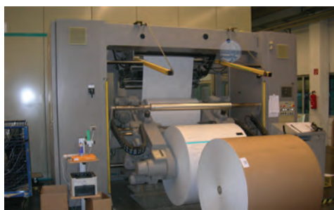
Rollendruckmaschine mit einer Reservepapierrolle

Ebner & Spiegel entstand 2002 aus der Zusammenführung der beiden Ulmer Buchhersteller J. Ebner GmbH & Co. KG (gegr. 1817) und Franz Spiegel Buch GmbH (gegr. 1930). Die Gebäude in Böfingen (Ebner) wurden renoviert und durch zwei Neubauten mit 3.200 und 3.400 qm ergänzt. Der Maschinenpark wurde ergänzt und optimiert. Allein im Jahr 2006 wurden 12 Mio. Euro investiert. Hergestellt werden Taschenbücher und gebundene Bücher (Hardcover) für alle bedeutenden Verlage im deutschsprachigen Raum sowie hochwertige Buchkalender für den europäischen Markt. Ebner & Spiegel fertigt an einem Tag mit einer Belegschaft von 450 Mitarbeitern bis zu 450.000 Taschenbücher sowie 170.000 Hardcoverbücher und Buchkalender und verarbeitet dabei etwa 120 Tonnen Papier.