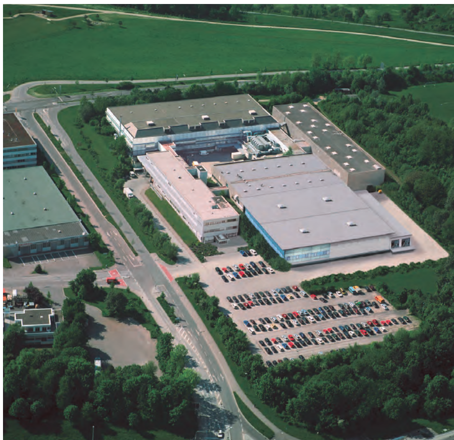
Die Gebäude der Fa. Ebner & Spiegel Eberhard-Finckh-Straße 61 im Böfinger Gewerbegebiet