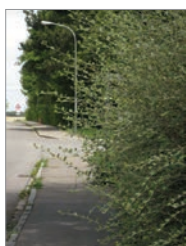
So sollte es nicht sein!

In Wohngebieten werden Sträucher und Hecken gerne als Sicht- und Lärmschutz angelegt. Beachten Sie aber, dass das niemanden behindert und nicht die Verkehrssicherheit einschränkt. Bäume, Sträucher und Hecken können eine Gefahrenquelle sein, wenn sie an unübersichtlichen Stellen die Sicht behindern, Straßenschilder verdecken oder über das Grundstück hinaus in den Gehweg oder die Fahrbahn ragen. Sie müssen also entlang der Grundstücksgrenzen regelmäßig gestutzt werden so dass über Geh- und Radwegen mindestens 3 m, über Fahrbahnen mindestens 4,5 Metern frei bleiben. Bei Fragen wenden Sie sich bitte an die Bürgerdienste der Stadt Ulm, Tel. 161-3224. gl