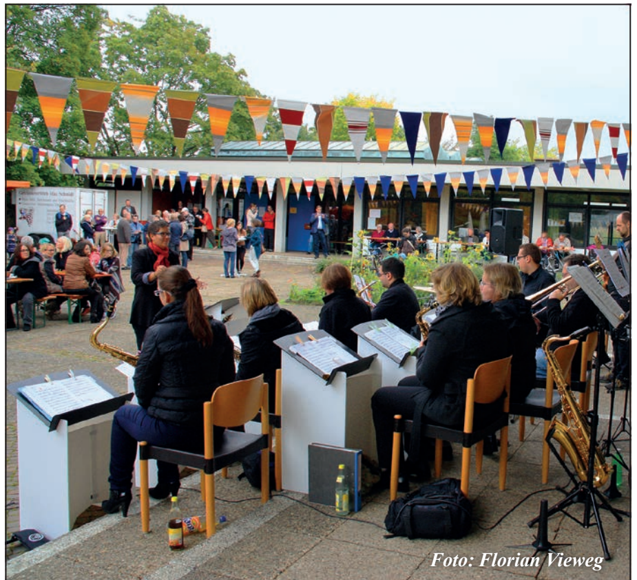
Der „Böfinger BigBandBiergarten“ war wieder ein tolles Ereignis!