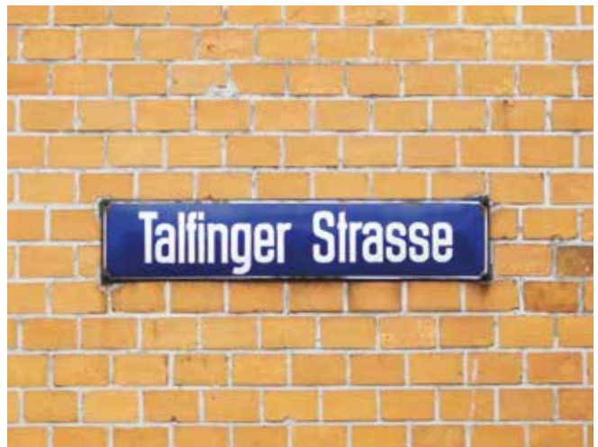
Talfingen oder Thalfingen – wie heißt es richtig? .