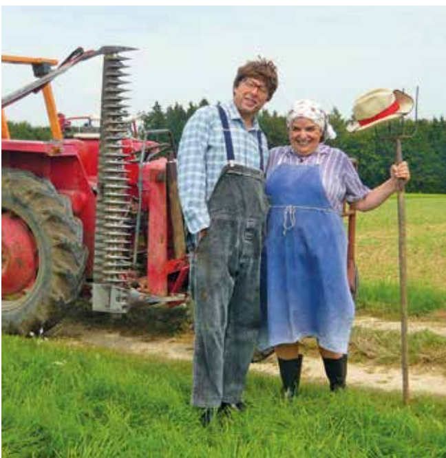
Hillus Herzdropfa sind am 6. September zu Gast in Böfingen.

Hillus Herzdropfa kennt man im Ländle als schwäbisch bäuerliches Ehepaar Lena Schuahdone mit ihrem angetrauten Maddeis (Gewinner des Sebastian-Blau-Preises 2016 in der Rubrik Comedy). Die beiden Vollblut-Äbler beherrschen es mit Bravour, aneinander vorbeizureden und sich misszuverstehen: originell und einzigartig! Im Duo unschlagbar!