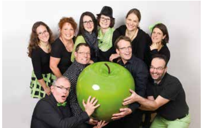
Auch „al dente“ ist am 5. Juli mit dabei.

Mehr Infos auf www.conficars.de oder bei conficars unter Telefon 0731/94645-50 oder E-Mail info@conficars.de