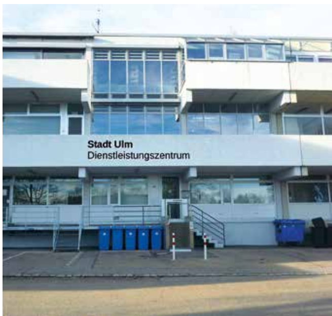
Vision vom „neuen“ Eingang des Dienstleistungszentrums – so findet künftig bestimmt jeder den Weg!

Gugad au, so kennds, wenn ma wella däd, aussäha.