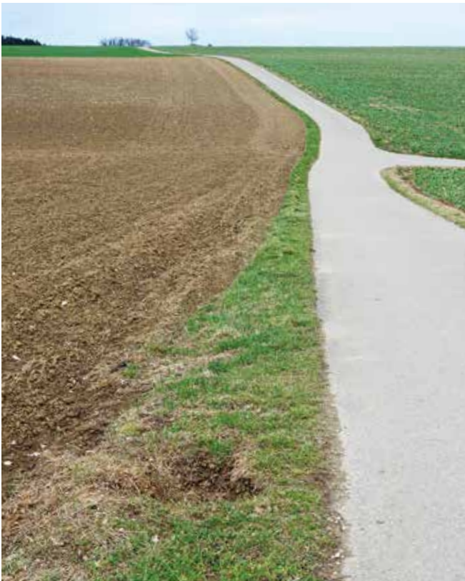
Warum klafft neben dem alten Postweg ein großes Loch?

Auf Seite 2 des Böfing er Bürgerblättles hatten wir gefragt, wo sich in Böfingen dieses Loch befindet.