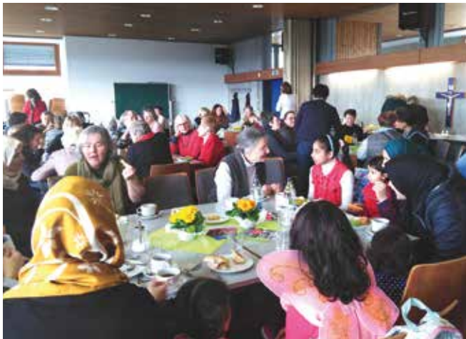
Reger Andrang beim Internationalen Frauenfrühstück.

Anlässlich des Internationalen Frauentages, der seit über 100 Jahren weltweit begangen wird, um die Gleichberechtigung von Männern und Frauen voranzutreiben, fand am 8. März ein Internationales Frauenfrühstück in Böfingen statt. Die Frauen strömten in Scharen und die Besucherinnen waren ebenso international wie das Buffet, auf dem neben Käse, Wurst, Marmelade und Obst auch Fladenbrot, Bohnenaufstrich und schwäbische Flachswickel, gebacken von syrischen Mädchen, zu finden waren. Aufgrund des großen Ansturms musste sogar noch nachgekauft werden!