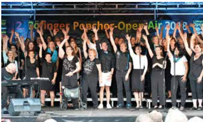
Gute Laune beim Böfingener Popchor Open-Air.

Am Freitag, 5. Juli ab 19 Uhr steigt auf der Bühne beim Jugendhaus das 3. Böfingener Popchor-Open-Air. Neben dem Popchor Ulm hat bereits „al dente – der chor mit biss!“ zugesagt. Die beiden bisherigen Ausgaben haben schon an die 1000 Zuhörer begeistert. Hoffen wir auf schönes Wetter! Der Eintritt ist frei, für Verpflegung ist gesorgt.