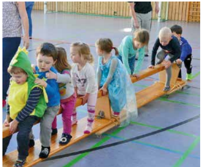
Wintersport am Sonntag.