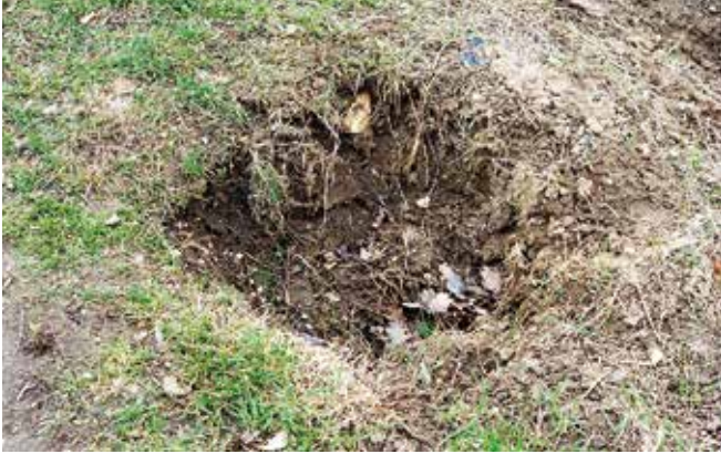
Dieses Loch hat eine interessante Geschichte.