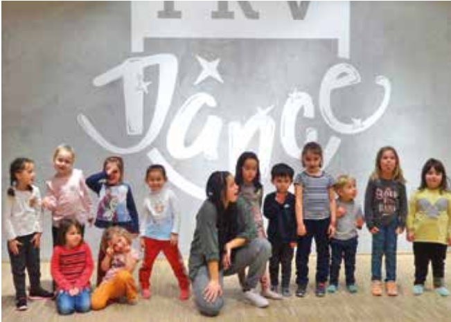
Die Kids hatten Spaß beim Tanzworkshop.

An dieser Stelle möchten wir uns einmal ganz herzlich für die Unterstützung bedanken, die wir von Eltern, Fachdiensten und aus dem Sozialraum erhalten. Über die Stiftung „Ulms kleine Spatzen“ konnten einige Kitakinder einen mehrwöchigen Tanzworkshop besuchen, der allen viel Spaß gemacht hat. Auch unser Outdoorangebot für Kinder und Eltern wurde mit Geldern aus Böfingen ermöglicht.