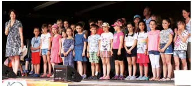
Mit Musik geht alles leichter.