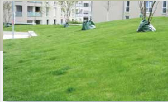
Das Einheitsgrün des Rollrasens.