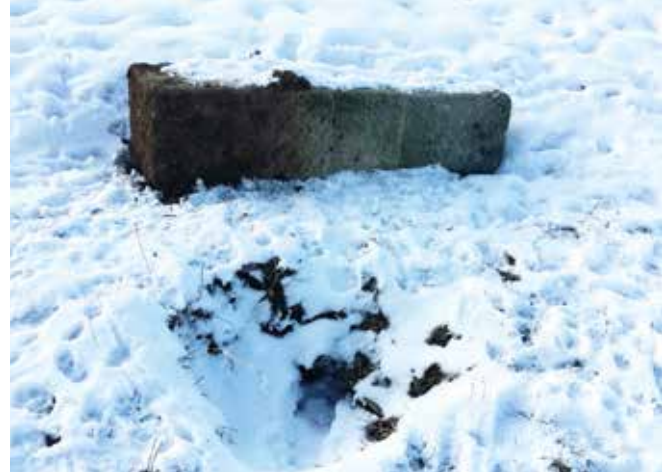
... hier liegt er im Schnee.

Der Markungs-Grenzstein kennzeichnete den auch heute noch gültigen Grenzverlauf zu Bayern. Der Mitte der 1990er Jahre zwischen Baden-Württemberg und Bayern erfolgte Flächentausch von Böfingener Grundstücken bezog sich nicht auf diesen Bereich, sondern auf das Areal am Hafenberg und das nördliche Obertal- fingen.