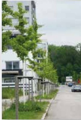
Die Ginkgobäume im Ernst-Bauer-Weg sind für Bienen uninteressant.