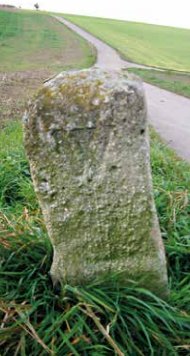
Hier steht der Grenzstein noch in voller Pracht ...