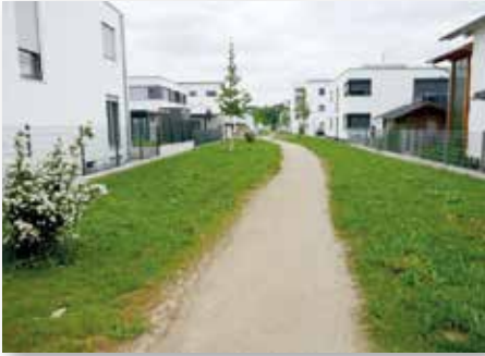
Dieser „grüne Finger“ sehnt sich nach mehr Sträuchern und Bäumen.