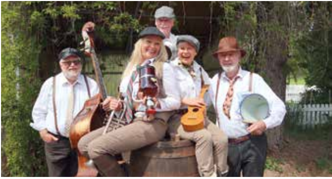
Stammgäste in Böfingen: die „untertoener“.

Am 30. November treten die „untertoener“ um 19.30 Uhr im kath. Gemeindehaus auf und stellen sich „Eine Frage der Leere“, so der Programmtitel. In ihren Sketchen und Liedern fördern sie allerlei Absonderliches, Vergnügliches und Verblüffendes zu Tage. Sie beweisen, dass das Leere so leer nicht ist, sondern geradezu ein Füllhorn abstruser Ereignisse und Fakten.