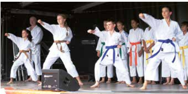
Die Karatekas des VfL standen auf der Bühne.

In zwölf Jahren nur ein einziges Mal Dauerregen – die Böfing er haben einfach Glück!